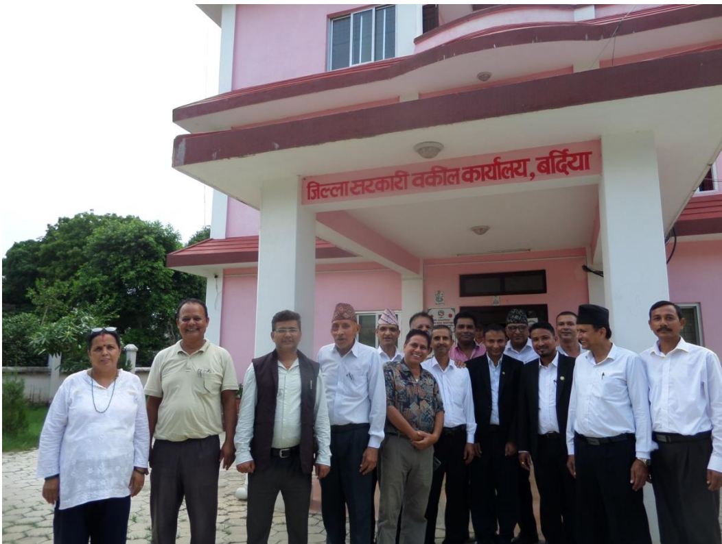
कार्यक्रमका सहभागी सरकारी वकील र कानून व्यवसायीहरू ।